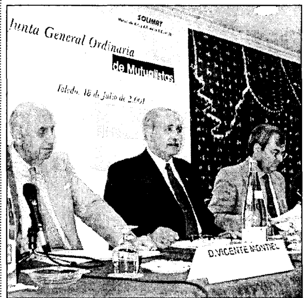
La Mutua celebró su junta general en Toledo.

Iveco ha mostrado su confianza en Hays Logistics desde 1999, confiándole el desarrollo logístico de sus almacenes en Inglaterra, Francia, Alemania, Italia, y también en España, concretamente en Azuqueca.