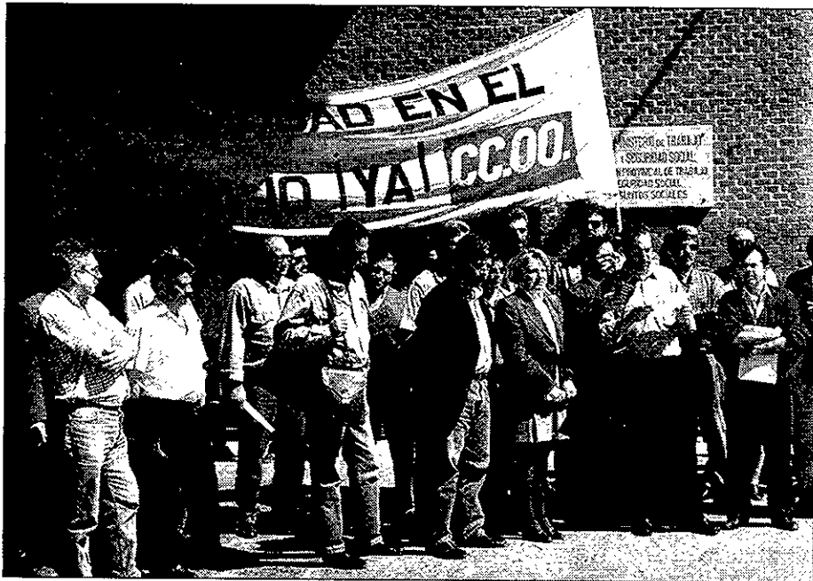
Los sindicatos exigen un mayor cumplimiento de la normativa por parte de los empresarios.

ANA MARÍA RUIZ. Guadalajara Coincidiendo con la celebración del Día Internacional de la Seguridad y la Salud en el Trabajo y «ante el creciente grado de deterioro de las condiciones de trabajo y el alto nivel de siniestralidad laboral», los sindicatos CC.OO. y UGT celebraron el pasado lunes una concentración de delegados ante las puertas de la Dirección Provincial de Trabajo. Dicha concentración se enmarca dentro de la campaña orientada a denunciar las consecuencias que el actual sistema de producción y sus modelos organizativos ocasiona en la salud de los trabajadores.