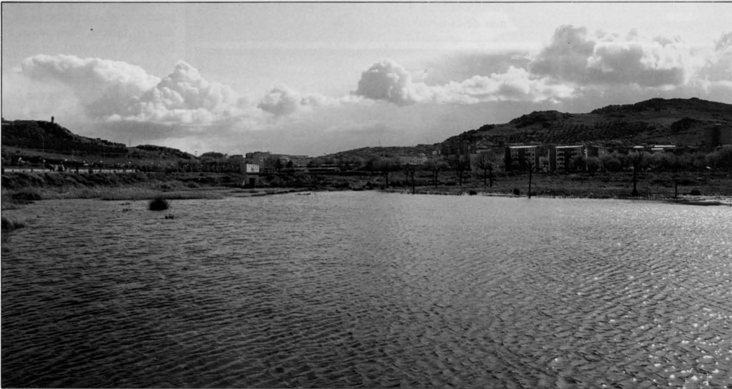
El proyecto de recuperación prevé la construcción de una pasarela que se adentrará en el interior de la laguna

El Ayuntamiento ha dado "luz verde" a dos importantes obras de urbanización en la barriada de las 630, que serán financiadas en su totalidad por la Junta de Comunidades. Por una parte, se ha concedido la licencia de obras para urbanizar el Sector I, segunda Fase, por importe de 233 millones de pesetas. Asimismo se construirán dos bloques de viviendas de promoción pública, en las calles Malagón y Piedrabuena, por un importe de 306 millones de pesetas. En total las inversiones en nuevas viviendas y urbanización superan los 500 millones de pesetas.