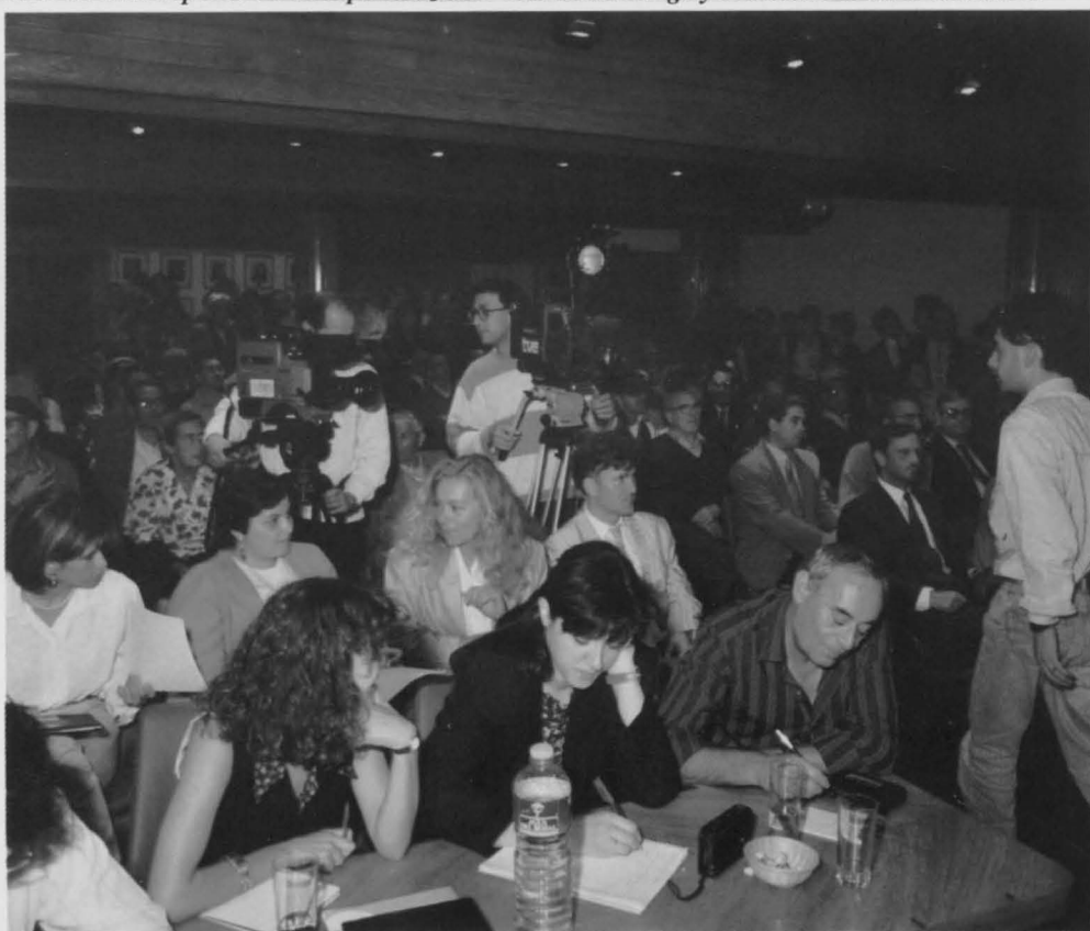
Numeroso público asistió a la toma de posesión del nuevo Alcalde.