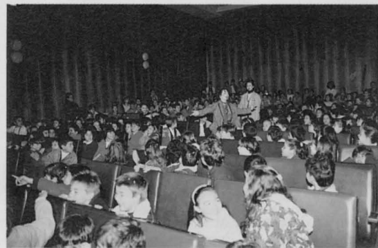
Representación infantil en las pasadas Navidades.

El grupo Algarabía llegó a Puertollano en agosto de 1985. En enero de 1990 iniciaban ya, en colaboración con el Ayuntamiento, el primer proyecto («piloto») de práctica teatral en los centros docentes, que concluía en el mes de junio con la I Muestra Local de Teatro Escolar, experiencia positiva, sin duda, a juzgar por la ilusión y el trabajo que están derrochando en este «segundo proyecto».