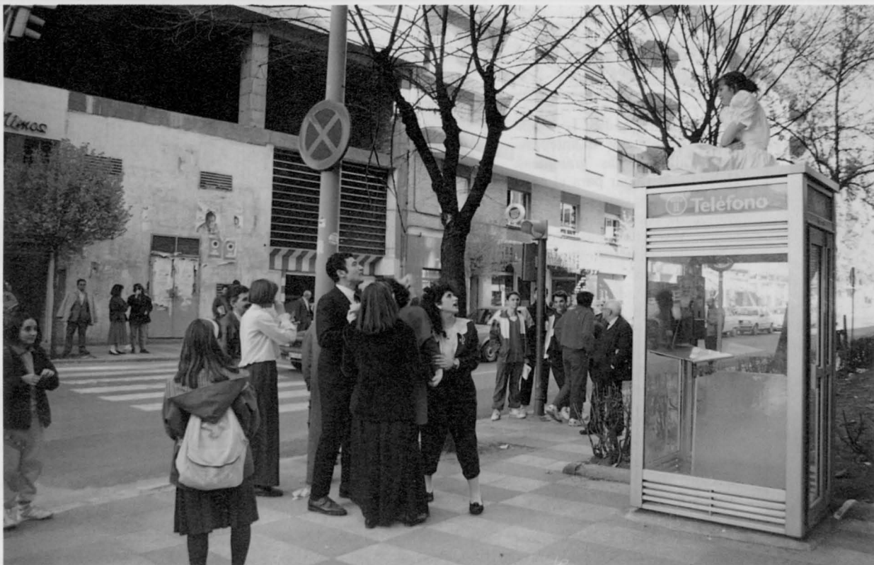
Teatro de Calle conmemorando el Día Mundial del Teatro.