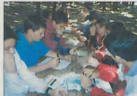
Los talleres son una de las actividades educativas realizadas en los campamentos (1999)

El plazo de inscripción queda abierto hasta el 10 de octubre de 1999. Si todo esto te resulta interesante y deseas recibir más información acércate por el Aula de Medio Ambiente de Miguelturra situado en el antiguo matadero o bien llámanos al 926 24 22 56 ó 630 661 443.