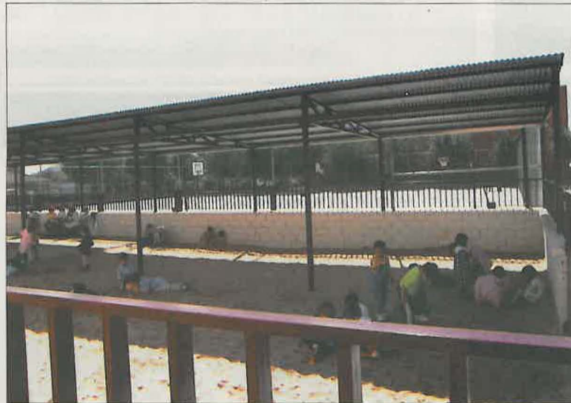
El Ayuntamiento, entre otras, realizó este verano las obras de ampliación, arreglo, remodelación y mejora del patio de recreo de Educación Infantil del C.P. "Benito Pérez Galdós", muy demandadas por toda la comunidad escolar.

gando al siguiente acuerdo: el Ayuntamiento ampliaría y mejoraría el recreo infantil; y el Ministerio ampliaría el recreo general del Colegio, para compensar el añadido a infantil, llevando el vallado anterior hasta unirlo