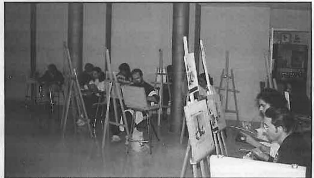
La nueva Casa de Cultura ofrece mejores instalaciones.