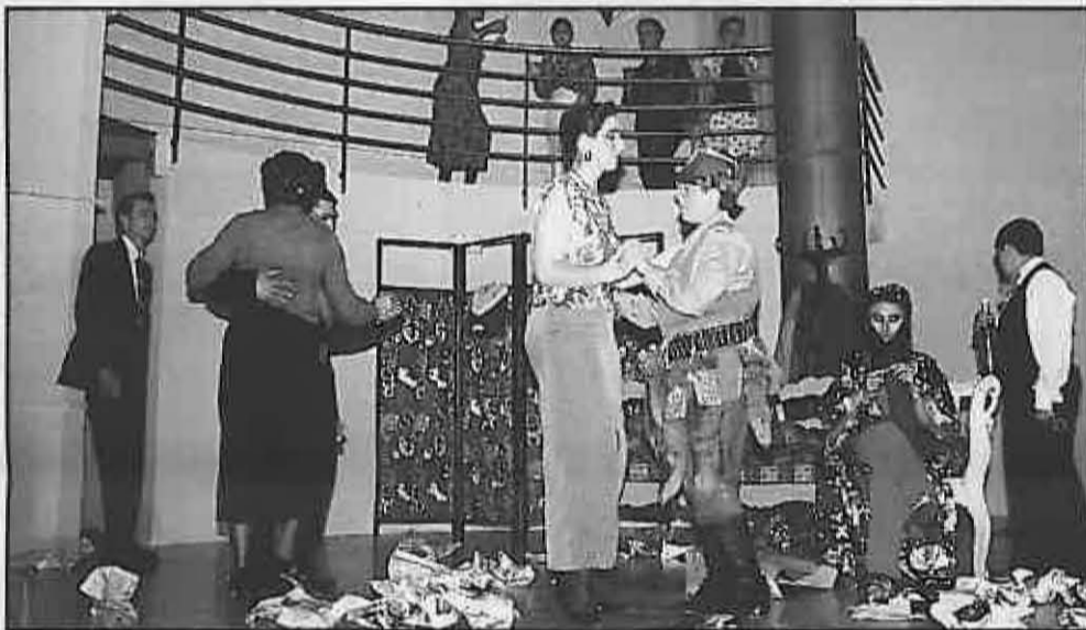
Flauti-Flauti, un grupo del Taller de Teatro. (1995)