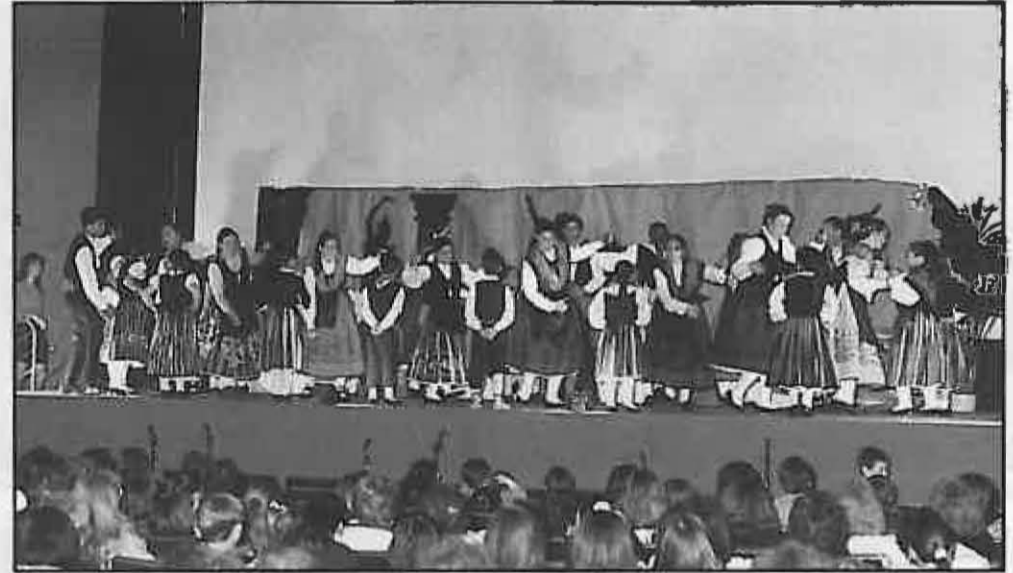
El Folklore también tiene su espacio en el programa. (1992)