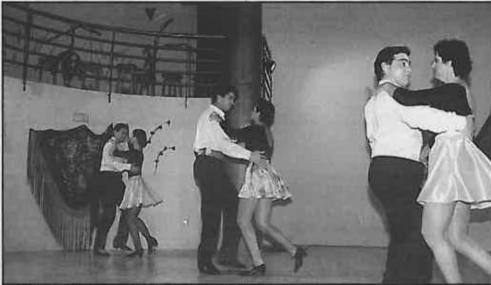
Los Bailes de Salón, una de las últimas novedades. (1995)