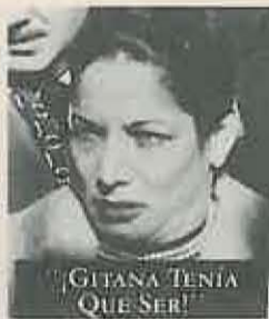
CARMEN AMAYA Bailaora