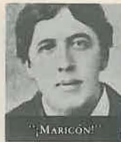
OSCAR WILDE Escritor