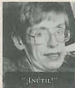
STEPHEN W. HAWKING Física y Matemática