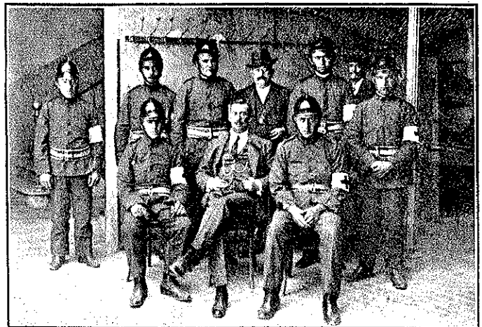
DAIMIEL.—1 y 2 Dos aspectos de la bendición de la Bandera. 3 Cuerpo de Bomberos.