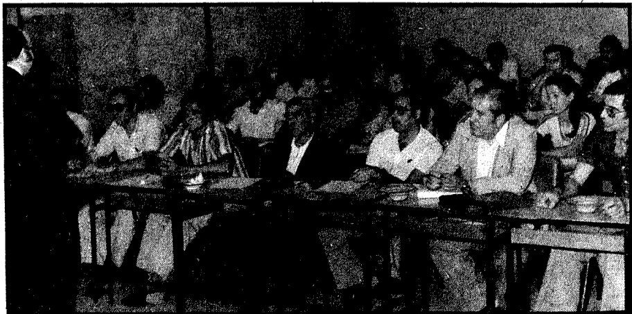
Los profesores de Enseñanza Profesional durante la última lección magistral del curso de perfeccionamiento.

A la vista de los resultados, los profesores asistentes opinaron que realmente dichos objetivos se habían cubierto.