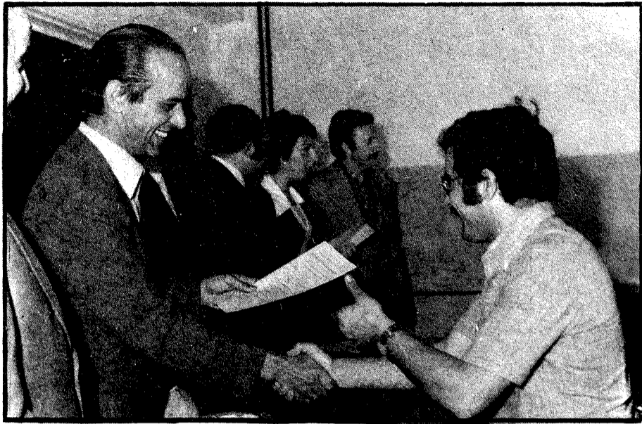
El Director de la Escuela de Maestría Industrial entrega el diploma a uno de los alumnos asistentes al cursillo.

Con asistencia del Delegado de Educación y Ciencia se clausuró el pasado día 29 de junio la segunda y última parte de los cursos de perfeccionamiento para profesores de Formación Profesional que el ICE (Instituto de Ciencias de la Educación) ha impartido a los docentes de Maestría Industrial, actualmente denominada Centro Nacional de Formación Profesional de primero y segundo grado.