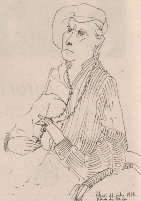
Dibujo de Pilar Gómez Bedate.

As palavras que te envio são interditas até, meu amor, pelo halo das searas; se alguma regressasse, nem já reconhecia o teu nome nas suas curvas claras.