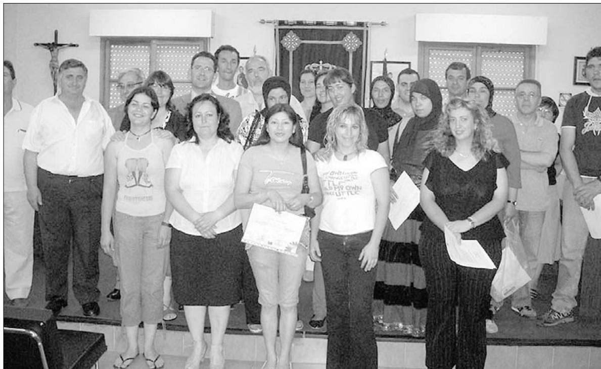
En el taller de empleo 'Nuestra Señora de los Santos II' sobre albañilería y carpintería metálica