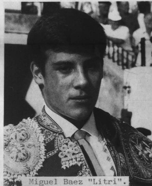
Miguel Baez "Litri".

bran, estos don novilleros son hijos de los afamados toreros Paco Camino y Litri