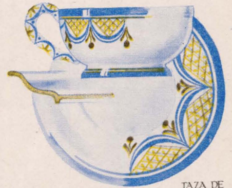
TAZA DE DESAYUNO