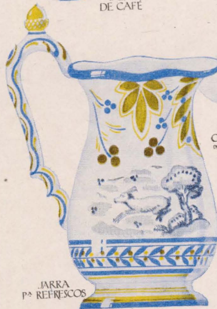
JARRA P a REFRESCOS