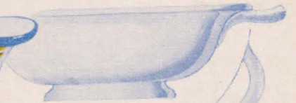
TAZÓN DE CONSOMMÉ DECORADO COMO LA TAZA DE DESAYUNO