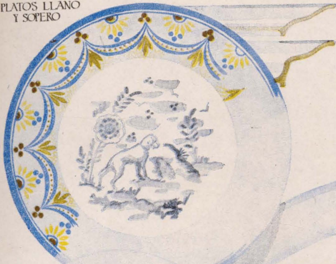
PLATOS LLANO Y SOFERO