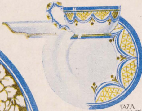
TAZA DE CAFÉ