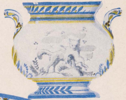
SOFERA 2 RACIONES