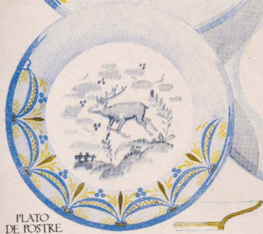
PLATO DE POSTRE