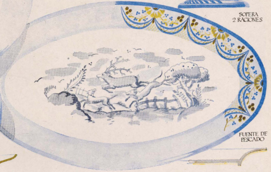
FUENTE DE PESCADO