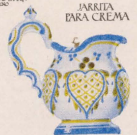
JARRITA PARA CREMA