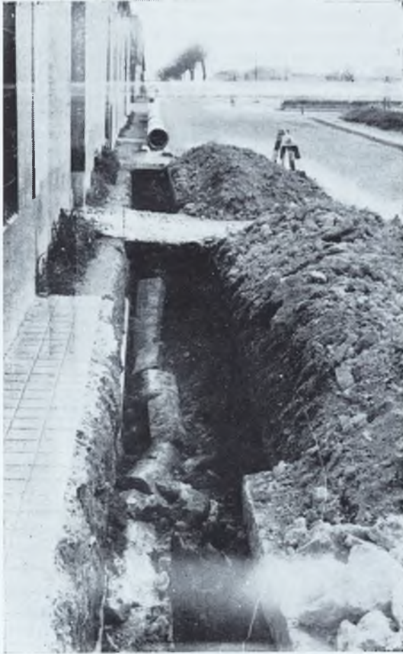
Ya se están instalando las tuberías de distribución del nuevo abastecimiento de aguas, por nuestras rondas. Pronto, muy pronto, todo será un sueño hecho realidad.

e' que deseábamos, pues hay que redactar proyectos, hacer subastas, cumplir plazos, etc.