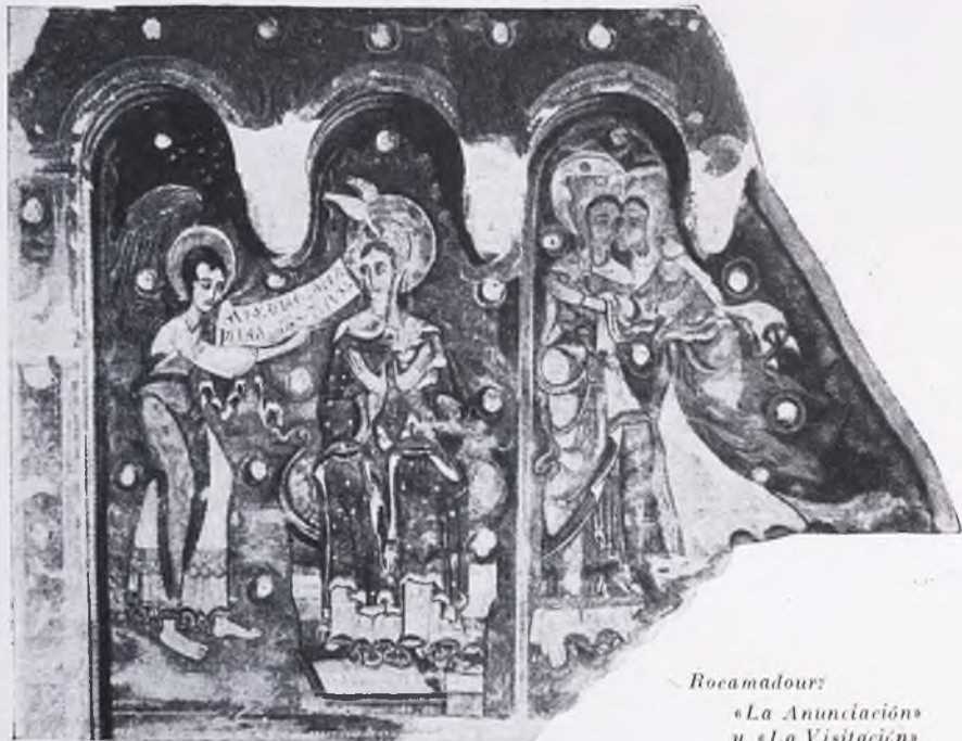
Rocamadour: «La Anunciación» y «La Visitación»

Puesto que el gusto por los museos se multiplica, los artistas y los coleccionistas se ingenian proponiendo colecciones inéditas. Son dignas de mención en nuestros días muchas iniciativas felices, entre las cuales tal vez ninguna tan digna de elogio como el museo recién abierto en París, en los salones del Palacio Chaillot: pinturas al fresco, es decir, pinturas realizadas sobre los grandes lienzos murales, y por consiguiente, de máxima dificultad para ser desplazadas de su lugar de origen y agrupadas en forma de museo.