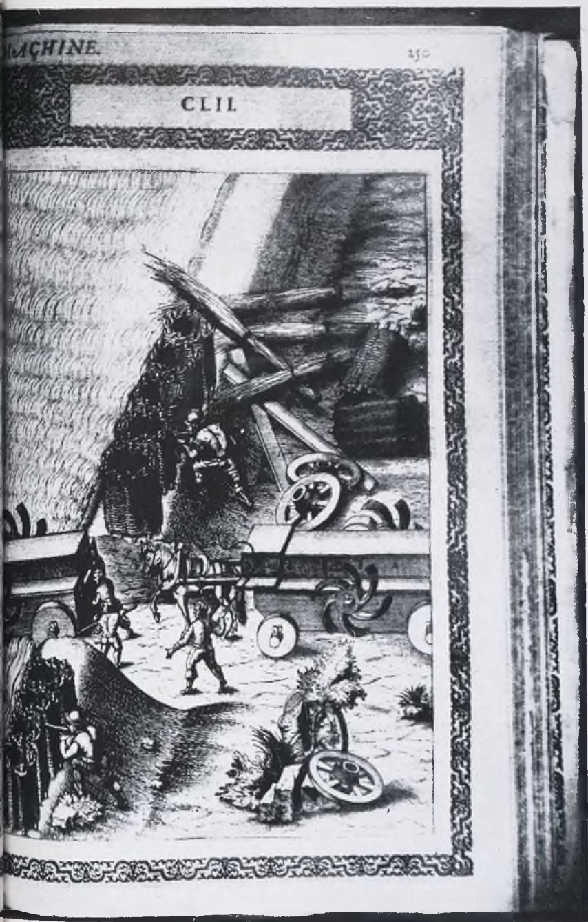
antibios (Ramelli, 1588)