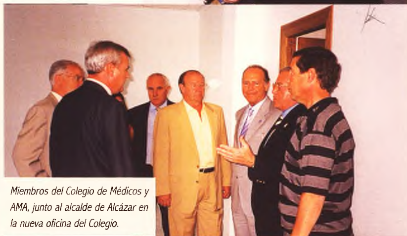
Miembros del Colegio de Médicos y AMA, junto al alcalde de Alcázar en la nueva oficina del Colegio.