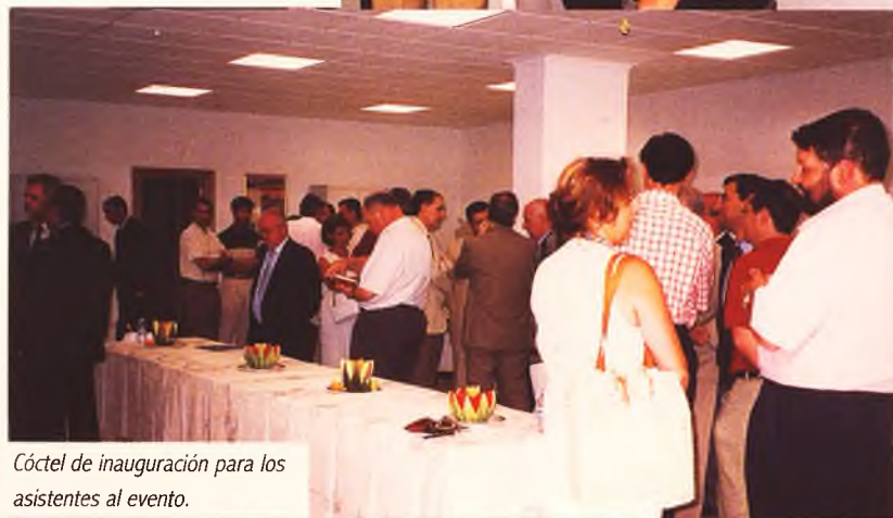
Cóctel de inauguración para los asistentes al evento.