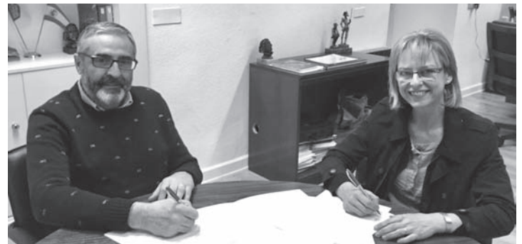
Un momento de la firma del convenio

Actúa es una asociación sin ánimo de lucro formada por voluntarios y voluntarias que funciona gracias a las aportaciones económicas y a la colaboración de sus más de 200 socios y al apoyo de una treintena de empresas. Trabaja para evitar el sacrificio de los animales abandonados, prestándoles la atención que merecen. Las personas interesadas en colaborar con la asociación pueden hacerlo a través de las redes sociales, en la Web http://actuanimalista.com o a través del correo electrónico actuasociacion@gmail.com .