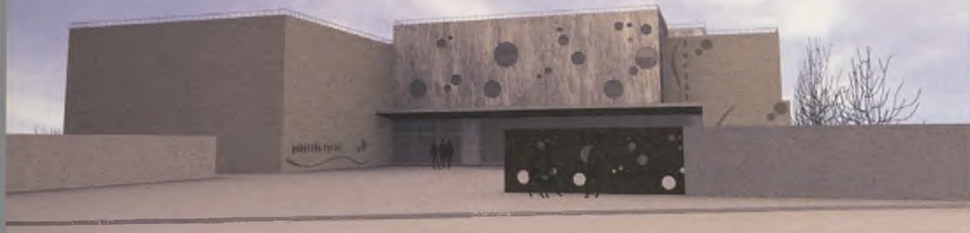
Entrada al recinto