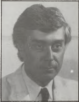
JAVIER RUPEREZ RUBIO CP - Cuenca Nació en Madrid, dos hijos, viudo. Licenciado en Derecho y en Periodismo Secretario de las embaja- das de Addis Abeba, Var- sovia, Helsinki y Ginebra. Miembro de la Delegación Parlamentaria española en el Consejo de Europa Diputado electo.