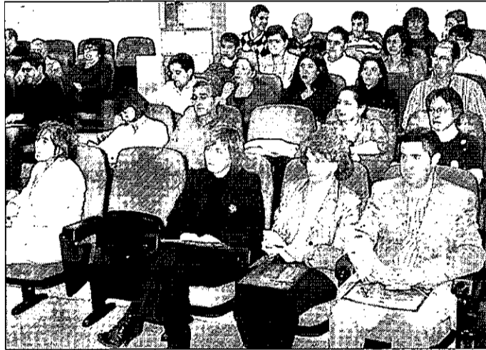
Algunos de los profesores que se dieron cita en este encuentro.

En estos mismos términos se pronunció el decano de la Facultad de Químicas, quien estimó necesario «oír la opinión de los profesores de los institutos para saber cómo actuar y preparar a los alumnos para los nuevos cambios».