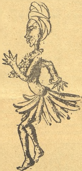
JOSEFINA BAKER, LA ARTISTA DE COLOR FAMOSA EN TODO EL MUNDO Y UNA DE LAS ATRACCIONES DEL TABARIN.

En el Tabarín desfilaron todas las grandes artistas de todos los tiempos. Desde Cleo de Merode, la Otero, la Duncán y Josefina Baker, exhibieron allí sus gracias, su arte y su simpatía. En el Tabarín tenían los artistas españoles siempre un trabajo que hacer. No había artista hispana de clase que no encontrara el escenario a su disposición. La clientela española e hispano-americana