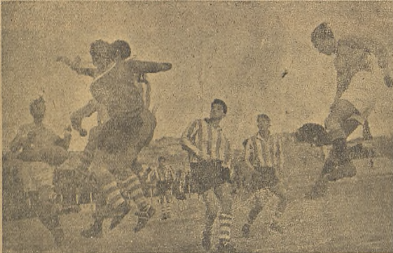
Una jugada en la meta del Tarancón toda llena de codicia por ambos bandos.

Pero lo más bonito del encuentro fué presenciar la pugna entre dos equipos puramente aficionados; el uno, el Girod, con su once amateur, pero veterano y