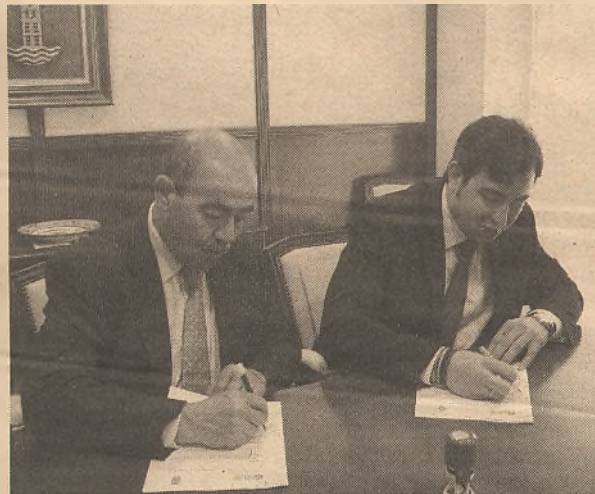
La firma tuvo lugar en el Ayuntamiento de Cabanillas.

Una firma que viene a fomentar el desarrollo de las empresas de la provincia de Guadalajara y de un municipio que, para este proyecto cuenta con la participación de 46 empresas.