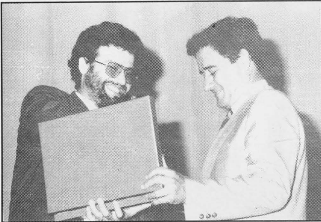
El alcalde entrega una placa al pregonero de la feria

por el Ayuntamiento, y contándose con la asistencia de diversas autoridades provinciales, entre ellas el presidente de la Diputación Provincial, Francisco Ureña.