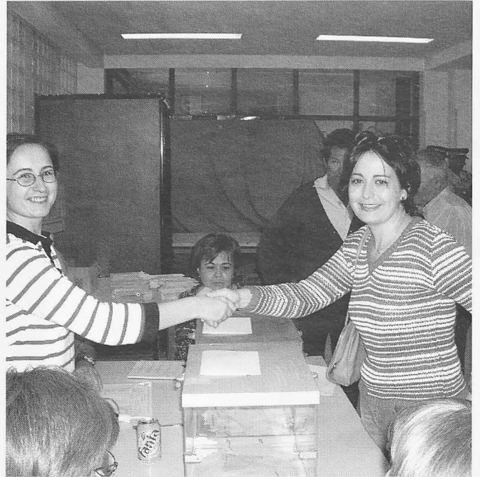
Los líderes locales del PSOE y del PP votaron en la Casa de Cultura.