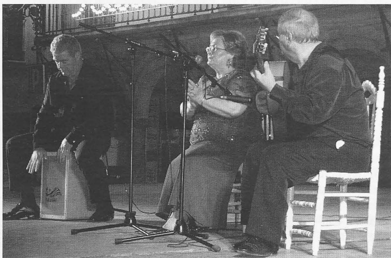
El flamenco no faltó a su cita con la feria.