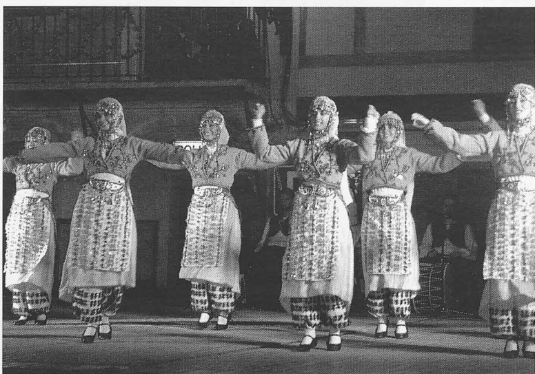
Varios grupos del Este mostraron su rico folclore.