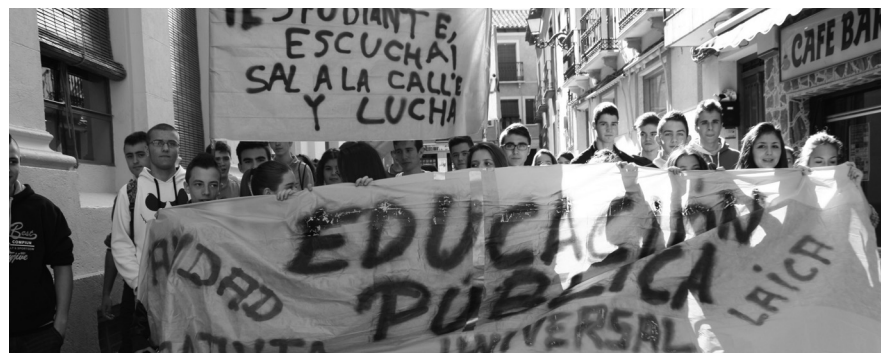
▲ Los estudiantes protestando por la céntrica calle Sagrario.

A su llegada a la Plaza Mayor, el grupo de estudiantes se vio incrementado con algunos profesores y padres, contando también con el apoyo del alcalde, Luis Díaz-Cacho, y algunos concejales del equipo de gobierno. Eso sí, el primer edil evitó hacer declaraciones argumentando que los protagonistas eran los estudiantes.