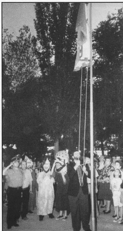
Otro reto. Arriba la bandera.