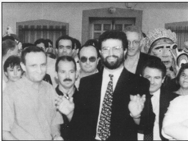
Comienza la Feria con el corte de cinta.