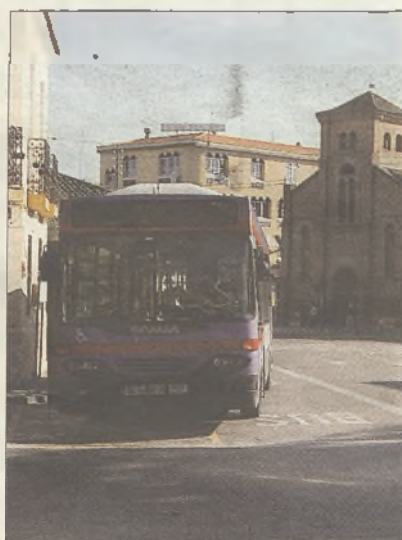
ALSA comenzará a operar en abril

Las alegaciones no han variado un ápice el calendario fijado por el equipo de Gobierno municipal, tal y como observó el Grupo Municipal Socialista en una rueda de prensa. "Hemos seguido trabajando con la adjudicataria", reconocía el edil popular, a pesar de estar pendientes de una resolución que,