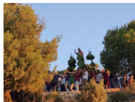
Bajada del Santo

La bajada del Santo y posterior pasacalles el día 15, muy multitudinaria. Es de agradecer la colaboración de los vecinos en los diferentes barrios, invitando a los asistentes a rollos requemaos, buñuelos, etc.