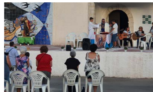
Misa a San Bartolomé en su ermita

Sí pudimos disfrutar de otros actos como la tradicional Puesta del Pino y misa a San Bartolomé en su ermita.