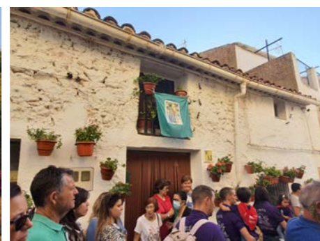
Calle San Marcos