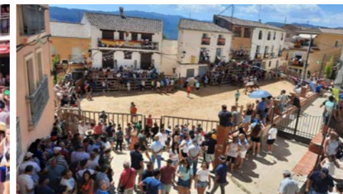
La plaza con una barrera menos