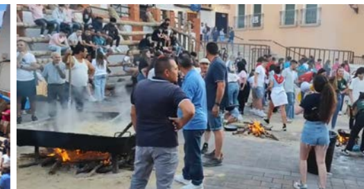
Mañana de migas

Pero al llegar la noche de la Romería nadie imaginó que poco antes de empezar la misa se iba a suspender la pirotecnia. Se echó de menos esa singular y especial subida, donde se une el fuego de las hogueras y el sonido de los fuegos artificiales al paso de San Bartolomé, con esas preciosas estampas de dibujos y colores que nos hacen mirar al cielo. Al finalizar, solo se pudo hacer un castillo de fuegos desde la plaza del auditorio que apenas se veía desde el cerro.