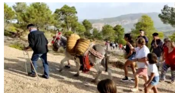
Pedro y su burro con más vecinos subiendo a la misa.

La bajada del Santo y posterior pasacalles el día 15, muy multitudinaria. Es de agradecer la colaboración de los vecinos en los diferentes barrios, invitando a los asistentes a rollos requemaos, buñuelos, etc.