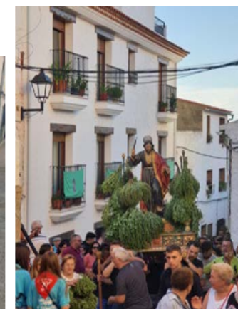
Pasacalles después de la bajada