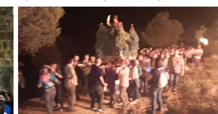
La luz de las hogueras iluminó el camino