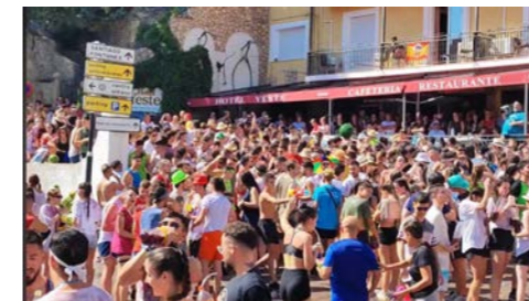
Concentración para subir a Llano Majano

El concurso de migas, la subida a Llano Majano desde la Plaza de La Orden, la suelta de vaquillas, verbenas, y otros actos que echábamos de menos, nos hicieron vivir la vuelta a la normalidad.