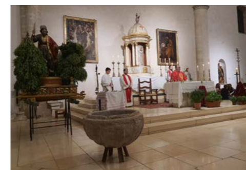
Solemne misa concelebrada en honor a San Bartolomé

¡Ojalá que al año que viene vivamos una romería igual que la hemos celebrado siempre o mejor, merecedora del reconocimiento otorgado! ■