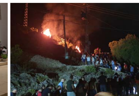
Inicio de la peregrinación la madrugada del 24