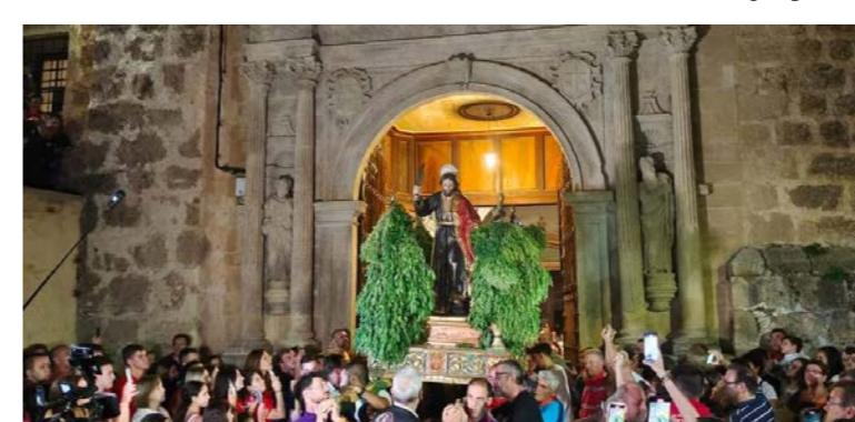
Todos dispuestos a iniciar la subida