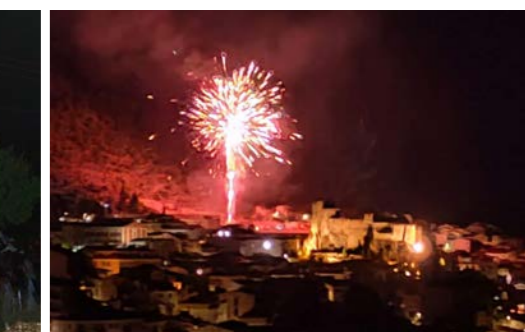
Fuegos artificiales desde la plaza del auditorio