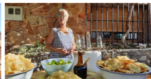
En la calle La Villa Joaquina