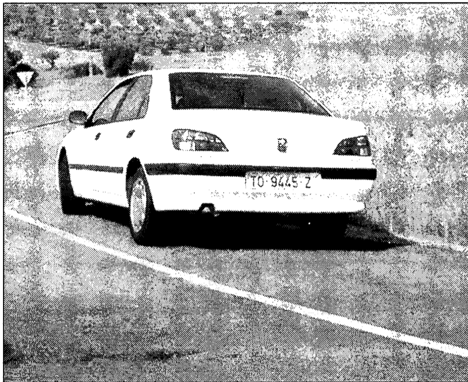
De las factorías de Michelin salen cada año más de 14 millones de neumáticos de turismo y demás vehículos.

carga y descarga. Según han señalado los responsables de la empresa, "su posición respecto de la carretera, su ubicación en un terreno eleva-