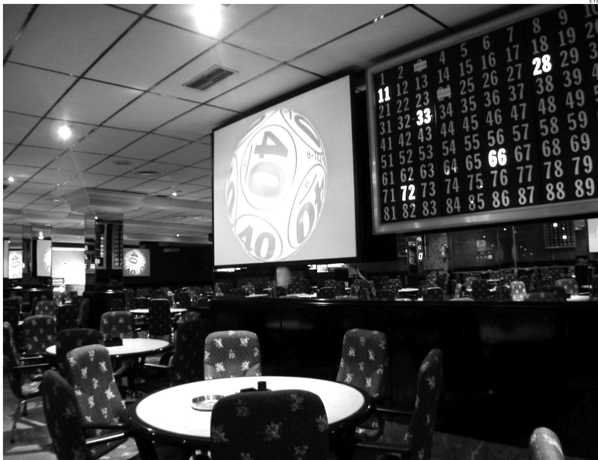
El volumen de negocio de los bingos ha descendido hasta un 40% en la región.

Los empresarios se quejan de que Castilla-la Mancha es una de las regiones que paga más impuestos a las distintas administraciones