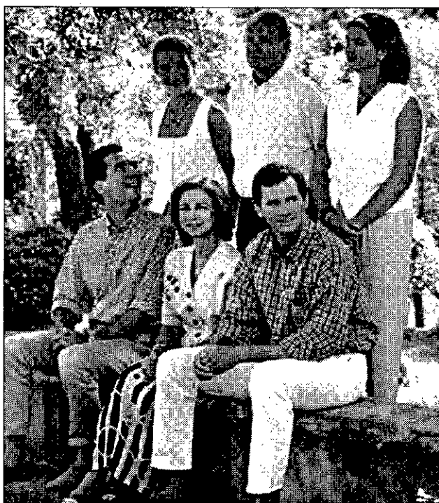
LA FAMILIA La Infanta Cristina no se había casado. Urdangarín vino luego.