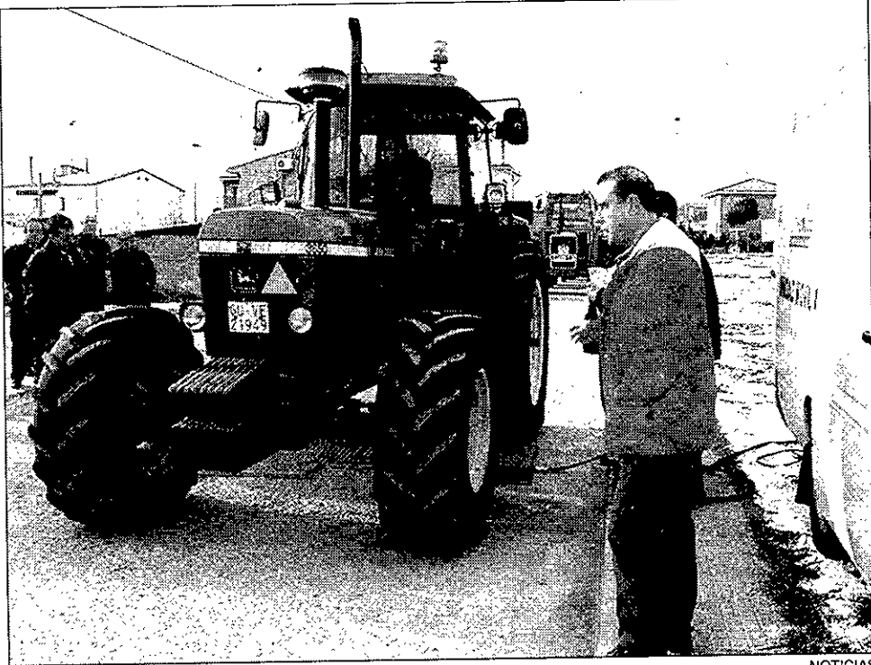
Los vehículos agrícolas no tendrán que desplazarse desde sus lugares de origen.