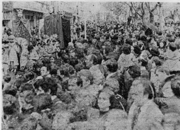
Así estaba el «Paseo» de San Gregorio

P.—Dentro de la Feria de Mayo, ¿qué actos destacaría usted, precisamente en cuanto a participación popular?