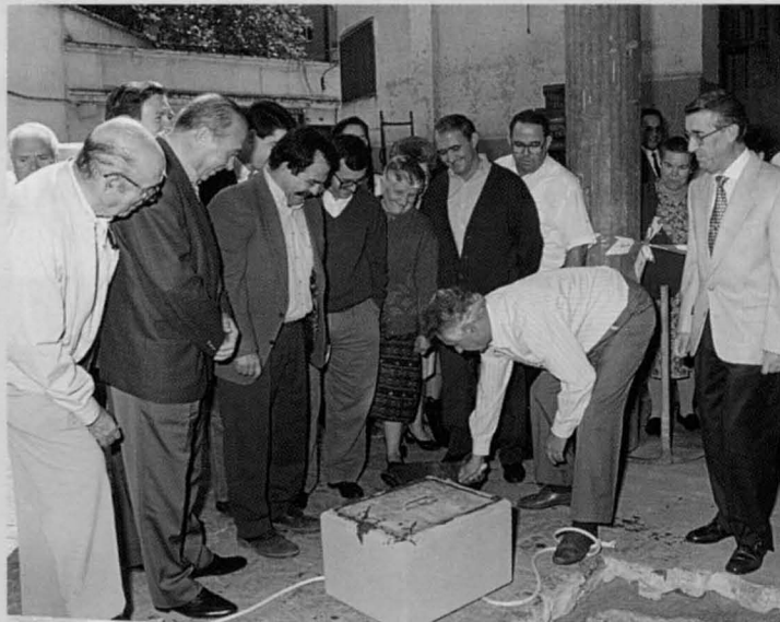
El alcalde sella con cemento la arqueta que simboliza la colocación de la "primera piedra" del Mercado. A la derecha, plano del edificio en la que se ve la distribución de los puestos.

Los agricultores se situarán en la plaza cubierta que sirve como muelle de descarga para abasteci-