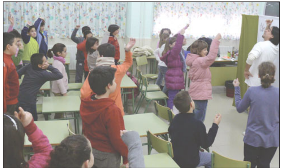
C.P. Benito Pérez Galdós y el C.P. Clara Campoamor

Estos talleres se han impartido también para niños de 5º de primaria del