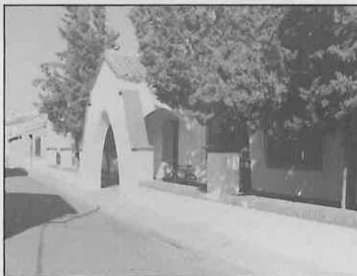
Una de las primeras medidas adoptadas por el nuevo Ayuntamiento fue conseguir una Biblioteca digna para los miguelurreños