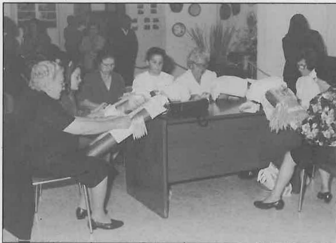
La Universidad Popular ha ampliado año tras año su programa y su participación. La recuperación de las tradiciones es también uno de sus objetivos.