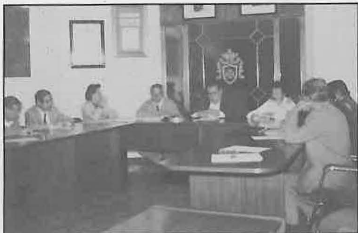
La Mancomunidad "Campos de Calatrava" permite alcanzar servicios comunes para los municipios que la integran. En la foto, una reciente reunión de los alcaldes en nuestro Ayuntamiento.

LICIA, TELEFONO MOVIL, EQUIPO INFORMatico, EQUIPO BASE DE COMUNICACION CON 6 MOVILES, SONOMETRO, ALCOHOLIMETRO, ARMERO, etc.