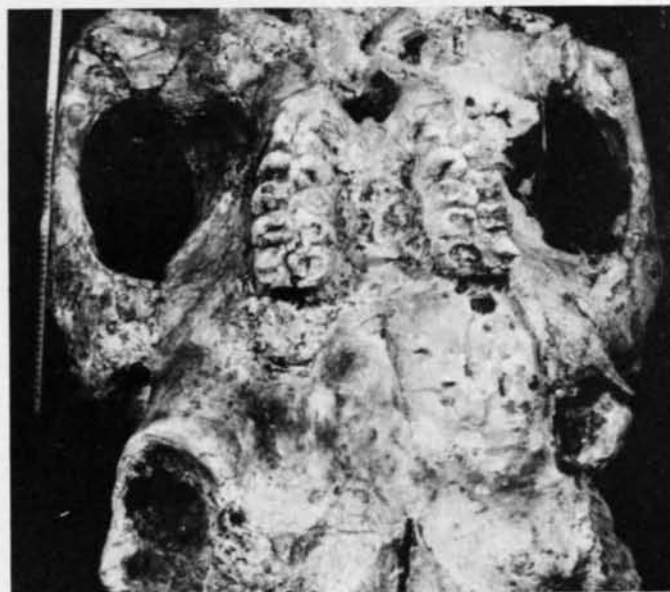
El mismo cráneo correspondiente a un individuo viejo visto inferiormente. Pueden apreciarse los terceros molares.