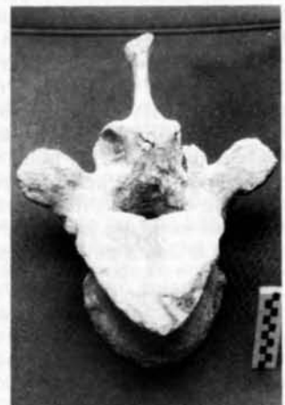
Vértebra de mastodonte procedente del yacimiento de Las Higueruelas (Museo Provincial de Ciudad Real)