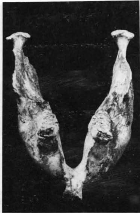
Mandíbula de otro mastodonte con los terceros molares, visto anteriormente.