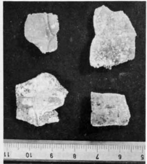
Placas de tortugas de pequeño tamaño en las que se pueden apreciar las suturas.