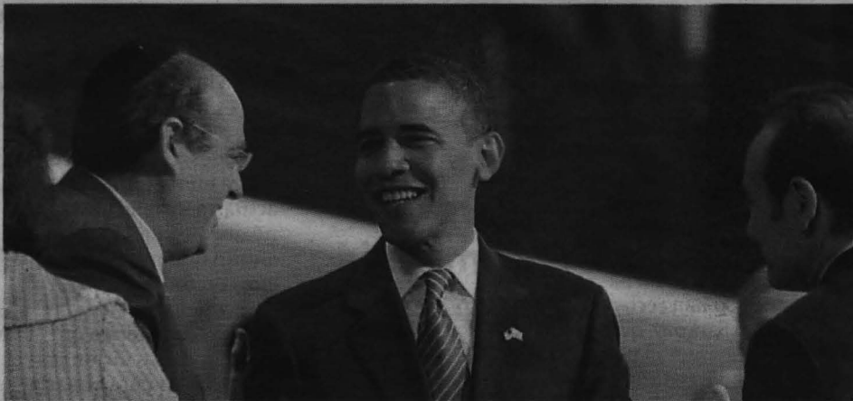
Obama saluda a algunos de los miembros del poderoso grupo de presión proisraelí.

Por primera vez, 138 años después de abolir un sistema esclavista que consideraba a la gente de piel oscura seres inferiores, un negro ha sido elegido por uno de los dos grandes partidos estadounidenses para luchar por la Casa Blanca.