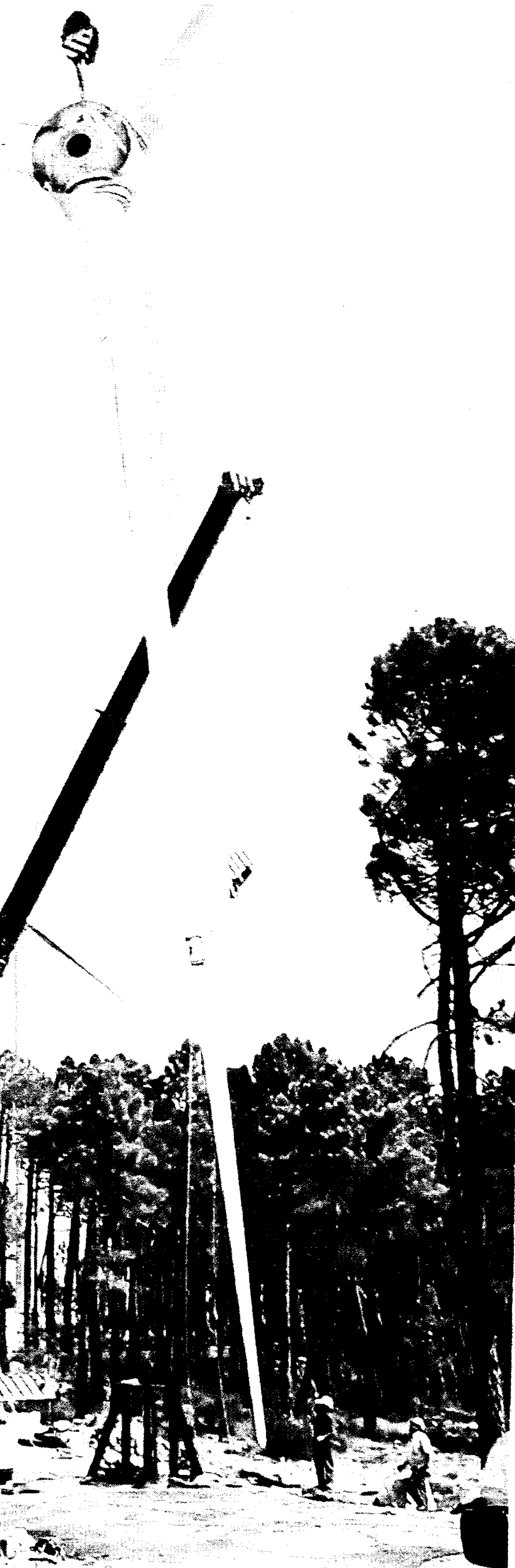
Operarios de Iberdrola proceden al montaje de uno de los molinos del parque eólico de Muela Cubillo