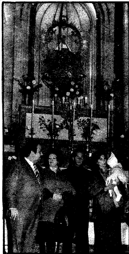
Cumpliendo una promesa a la Virgen del Prado.

Hablamos del tema, aun candente, de la huelga de los subalternos. —¿Cuál ha sido tu postura en esta huelga?