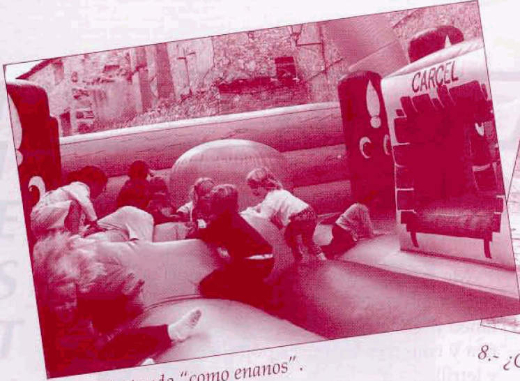
7.- Disfrutando "como enanos".