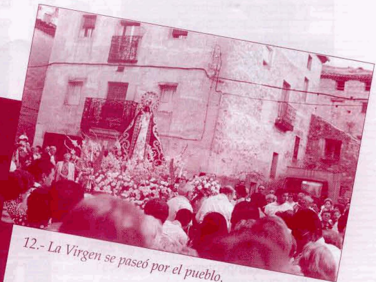
12.- La Virgen se paseó por el pueblo.