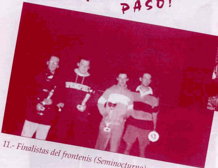
11.- Finalistas del frontenis (Seminoturno) para jóvenes