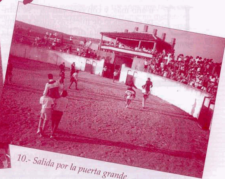
10.- Salida por la puerta grande.