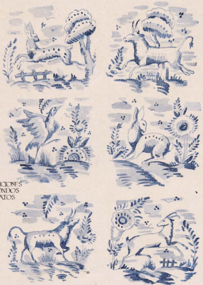
COMPOSICIONES PARA FONDOS DE PLATOS