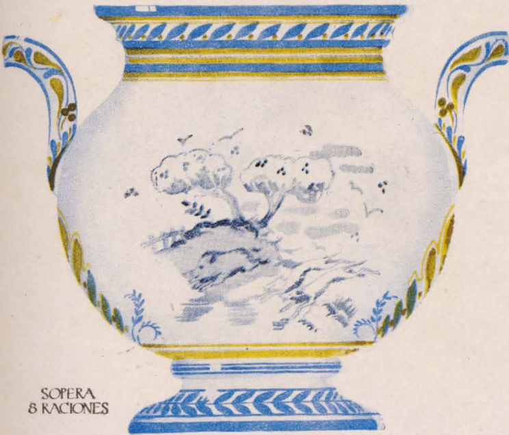
SOPERA 8 RACIONES