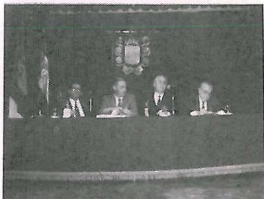
Revista "Despertar", un nuevo esfuerzo informativo para Castilla-La Mancha