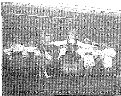
Apoteosis en el fin de fiesta: Una escena de "Katuska" interpretada por nuestro Club de la Zarzuela.