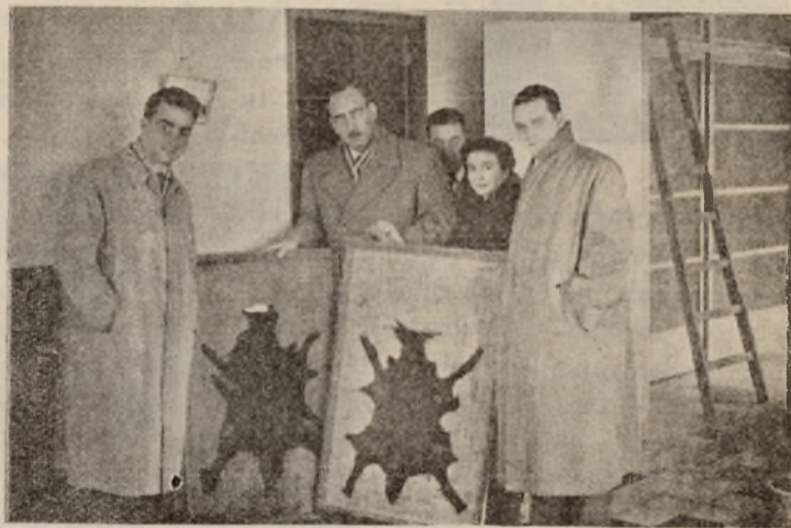
VALDEPEÑAS.—Visita a la Estación Pecuaria, centro de primer orden en España en la cría, selección y explotación del ganado karakul