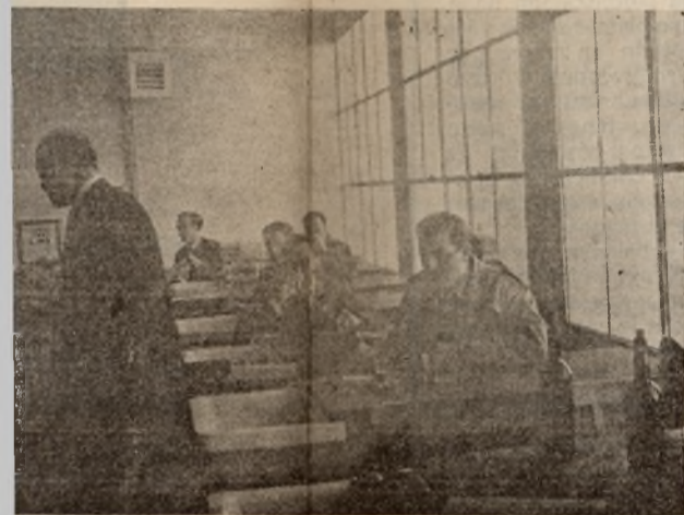
DAIMIEL.—Prácticas en el laboratorio del Instituto Laboral.

nto se incorporarán os Laborales de nue- esores del Ciclo Es- s. Titulados la ma- en la de Veterina- señorita farmacéuti-