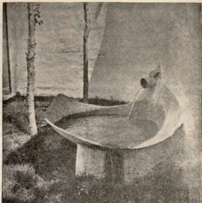
Detalle ornamental del jardín es la fuente hecha con los más típicos y sencillos elementos manchegos: el cántaro y un trozo de tinaja.

La Biblioteca del Centro está unida a la Municipal, si bien los libros y fichas van marcados con sellos diferentes. Cuenta ya con más de 1.500 volúmenes y se esperan en fecha próxima nuevas remesas, tanto por parte de la Dirección General de Enseñanza Laboral como por la Junta de Intercambio y adquisición de publicaciones. En cuanto estén terminados los ficheros, se procederá a su inauguración para el público, aunque en la actualidad ya la utilizan los alumnos y profesorado del Centro.