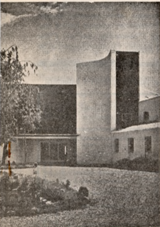
macizos de verdor, un pequeño estanque, amplios senderos, plátanos, chopos y álamos...

Una galería secundaria conduce a la sala de profesores, próxima a la entrada, y al laboratorio de química, cuyas